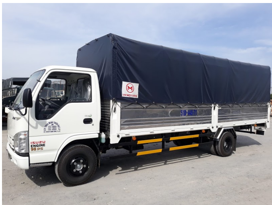
xe tải thùng mui bạt isuzu vm nk490sl 1t9 thùng dài 6m2 sản xuất 2018.

Linh kiện xe Vm mottor được nhập khẩu đồng bộ do isuzu QINHLING CHONGQINH CHINA cung cấp , bản quyền thiết kế từ nhà máy thương hiệu nhật bản, được cung cấp duy nhất và tiêu chuẩn dựa trên sự giám sát từ nhà máy nhật bản, được thử nghiệm và đánh giá chính xác trên nhiều địa hình và thời tiết khác nhau, sản phẩm được đánh giá là sản phẩm chất lượng cao, an toàn bền bỉ , phù hợp thân thiện với người sử dụng , an toàn môi trường. được sự tin cậy của thị trường chung châu á, và là bạn đồng hành cạnh tranh lớn nhất với nhiều sản phẩm khác trong cùng phân khúc sản phẩm.