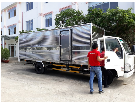
xe tải isuzu thùng kín chiều dài 6m2 tải trọng 1t9 vm vĩnh phát.